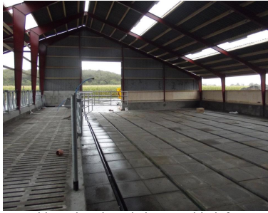
Nyetableret bund med slanger til beluftning. Slangerne er anbragt imellem rækker med to stk. 60x60 cm fliser, som beskytter slangerne mod skader ved fræsning og grubning.