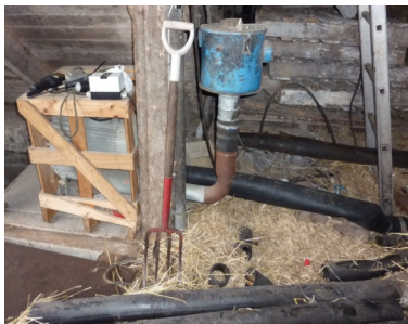
Kornblæser (i trækasse) tilsluttet gl. vandingslanger med huller i, som leder luften ind under komposteringsmåtten.