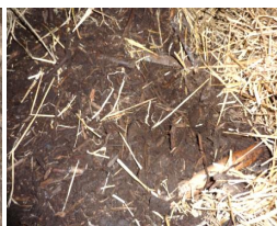
Have-park-affald tilsat granflis (siden dækket med halm)