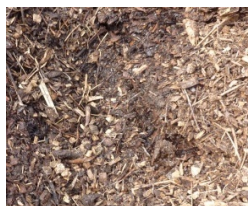
Flis af normansgran (ikke færdigomsat)

(klik på billederne og få dem vist i stor størrelse)