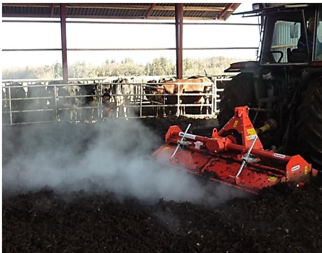
Når der harves/fræses i komposten damper det, uanset om der blæses luft i samtidig eller ej.

Der blæses ofte i komposten samtidig med, at der harves/fræses. Det frigiver damp.