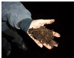
Tilpas porøst komposteringsmateriale

Efter denne “første vinter” var der i maj 2012 kun én tilbage, som stadig havde køer på komposteringsmåtte. De øvrige har måtte “kaste håndklædet i ringen” underevs, fordi omsætningen i måtten, af forskellige årsager, gik i stå, og måtten dermed ikke længere opfyldte kravene til et godt underlag for køerne.