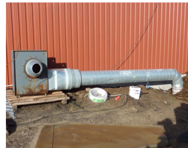
Blæserens luft fordeles til slanger i hele stalden.

Der blæses ofte i komposten samtidig med, at der harves/fræses. Det frigiver damp.