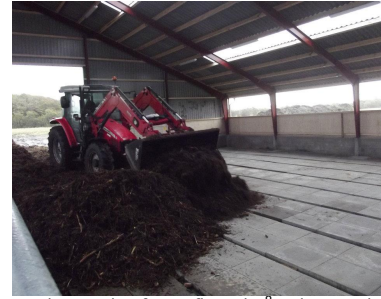
Her køres den første flis ind på gulvet med indbygget beluftning.

(klik på billederne og få dem vist i stor størrelse)