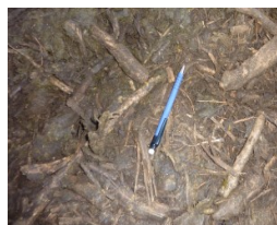
Groft knust træ

Komposteringsmåtterne er her i det første år (2011-12) opstartet ved at udlægge et 0,5-1,0 meter tykt lag flis i hele hvilearealet. De seks pionerer udi komposteringsstalde brugte træflis af forskellige typer (groft have-park-affald, rødgran, normansgran, pil og blandet løv). Noget var meget groft og andet finere. Indholdet af grønt og let nedbrydeligt materiale varierede også.